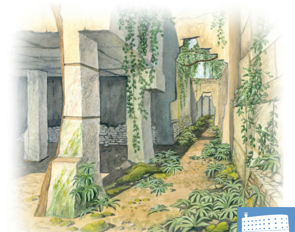
La même salle aujourd'hui gagnée par la végétation...