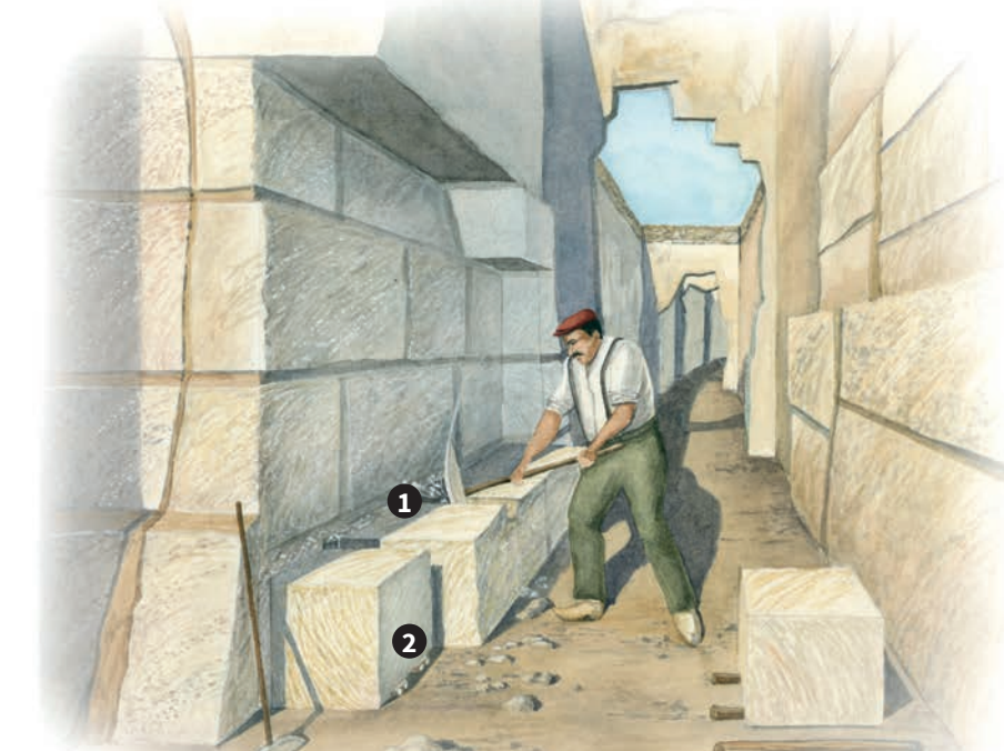
Une salle au temps de l'exploitation des carrières: armé d'un pic à trancher, le carrier réalise une tranchée verticale de 8 cm autour du bloc 1. Des coins et des paumelles 2 permettent de dégager sa face ancrée au sol.

la masse de se décoller. Après l'extraction, les carriers déplacent le bloc de pierre en le faisant glisser sur des rondins de bois 11. Une fois à la surface, leur prix sera négocié avec le marchand de pierre 12.